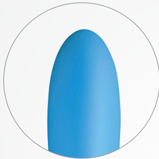
TOUCHER DOUX ET SOYEUX CHAUFFE POUR DES SENSATIONS NATURELLES