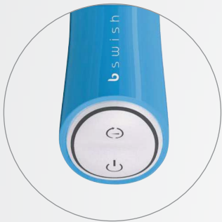
FACILE À CONTRÔLER & BOUTON LUMINEUX ROUGE